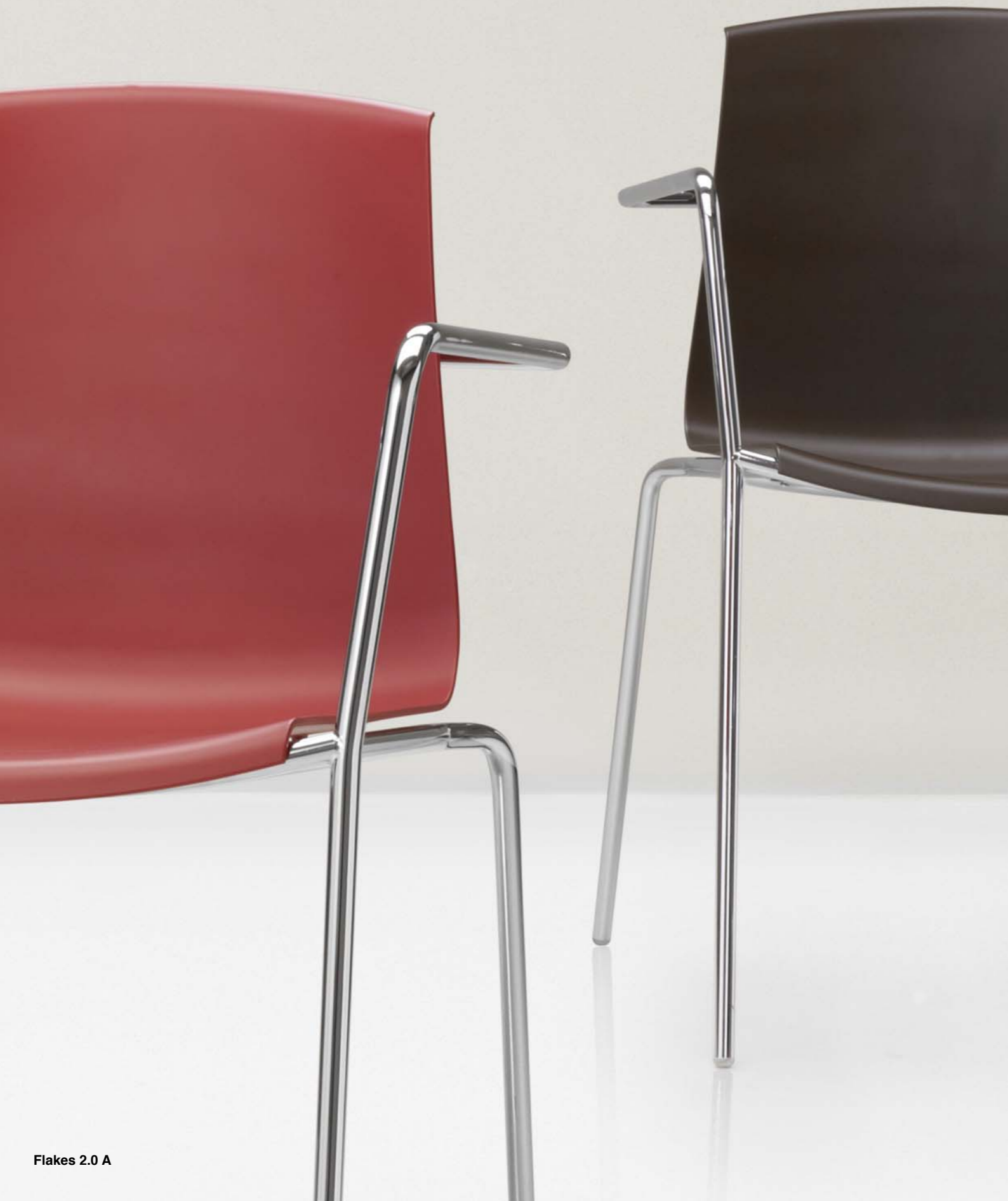
Flakes 2.0 A