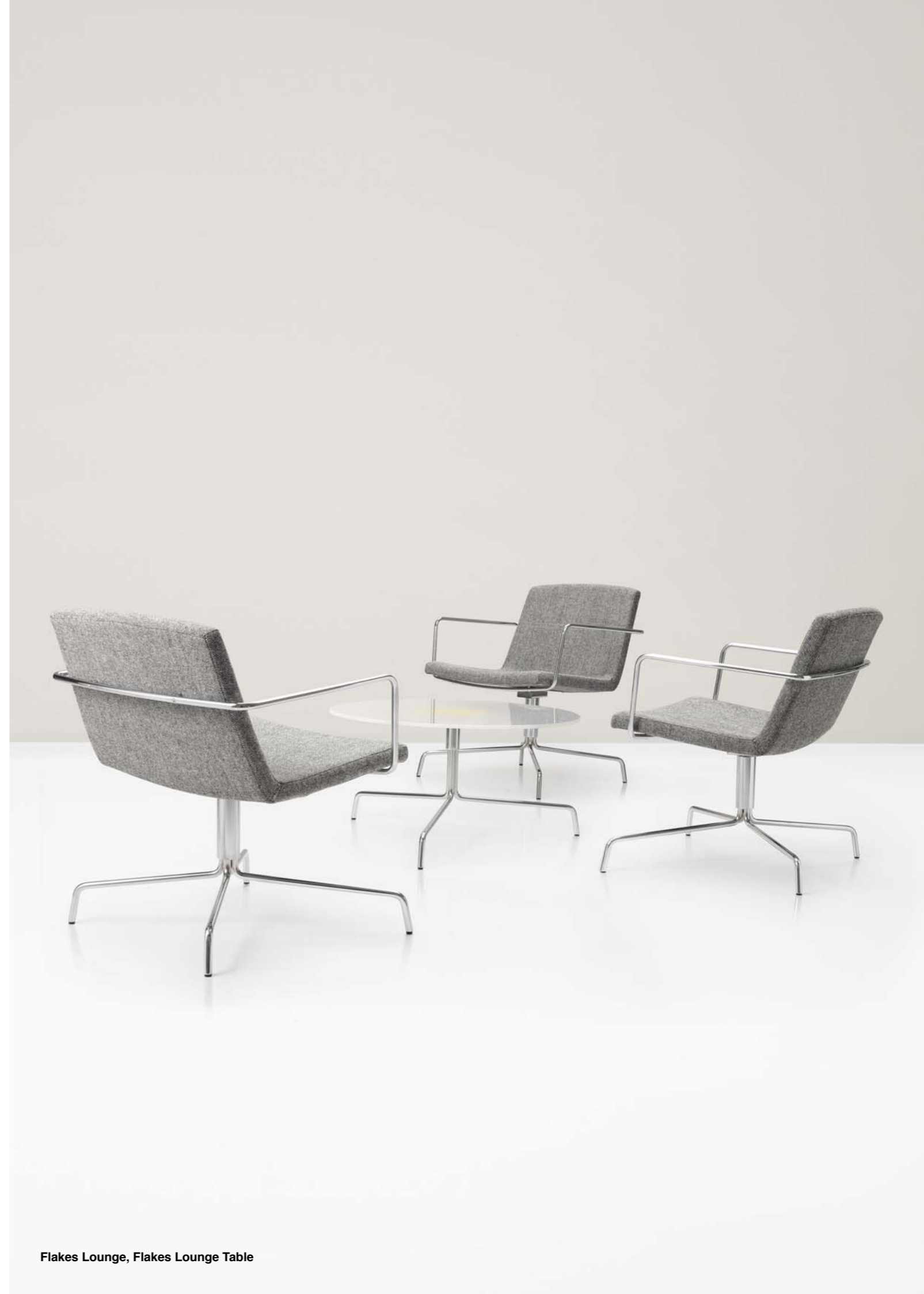
Flakes Lounge, Flakes Lounge Table